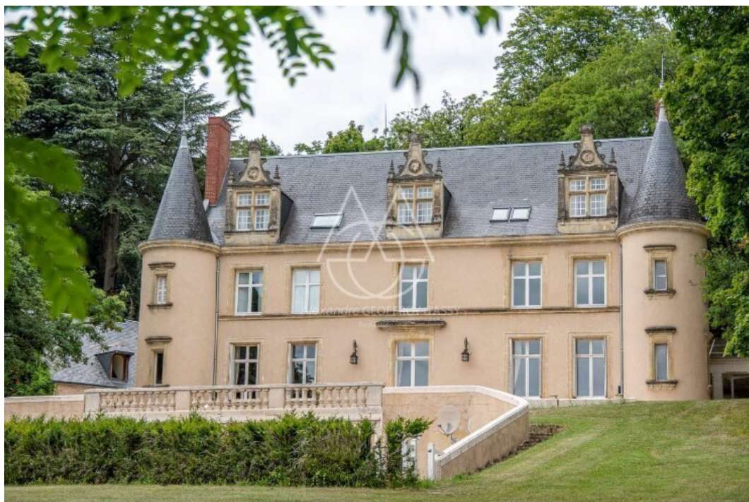
TOURS, Indre-et-Loire, FRANCE 1 920 000 €