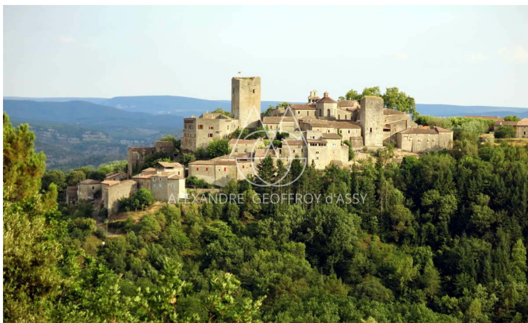
AUBENAS, Ardèche, FRANCE 1 861 000 €